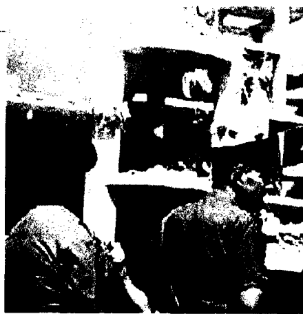
Abbattimento di edifici abusivi a Casalnuovo

In Campania nel 2005 è stata sciolta, primo caso in Italia (poi è accaduto anche a Locri), anche un'azienda sanitaria locale, la Asl Napoli 4 di Pomigliano d'Arco. Ora è a rischio anche la Asl Napoli 5, oggetto di un'indagine dell'Alto Commissariato anticorruzione