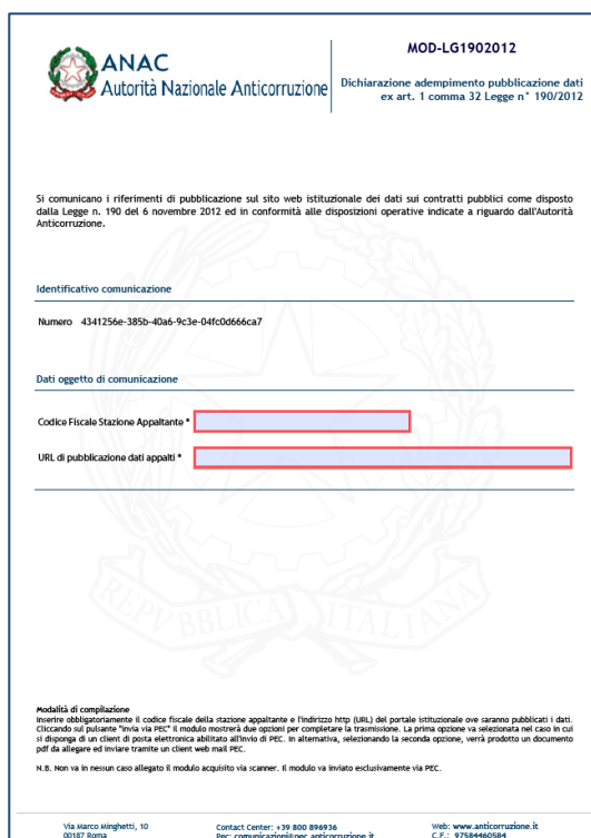
Figura 1 - Esempio di modulo PDF per la dichiarazione di adempimento

E' mostrata di seguito un'immagine con il modulo PDF da utilizzare per la comunicazione: